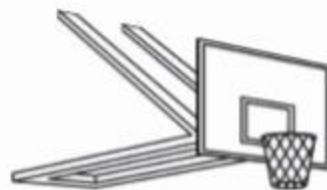
Type 3: Rabattable sur mur