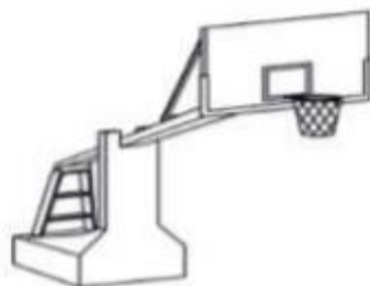
Type 1 : Autostable à déport: