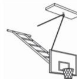
Type 5: Relevable en charpente ou mur